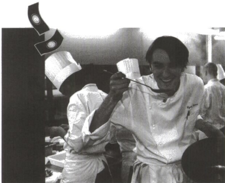
Télévision, édition, restaurants... Cyril Lignac capitalise sur son nom.