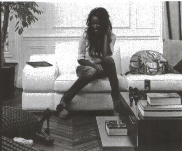
Le marketing de soi, l'arme fatale d'Hapsatou Sy.